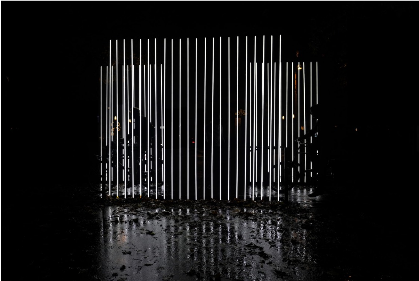
Transitie Oosterpark / Linnaeusstraat