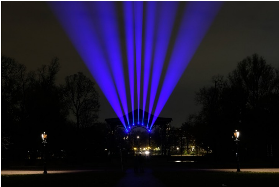
Muziekkoepeel Oosterpark @ Parklicht 2018

De plattegrond is essentieel omdat sommige kunstwerken enigszins verdekt zijn opgesteld. Dit geldt maar ten dele voor Transitie Oosterpark / Linnaeusstraat, een werk dat op het eerste gezicht níet, maar op het tweede gezicht wél oogverblindend zal zijn.